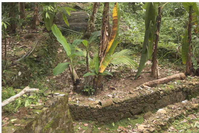
Terrassering av dyrket mark, for å hindre jord-erosjon.

Vi gikk en runde for å se mer av HELPs virksomhet. Vi besøkte et ektepar som var veldig fattige, bodd i et lite steinhus, hvor de gjennom HELP hadde fått planter og lært å dyrke mahognitrær. HELP fikk trær fra skogbruks-/jordbruksdepartementet, og kunne distribuere videre til mennesker og lære dem opp i hvordan plante og kultivere. Mannen kom senere med kokosnøtter til oss. De vil gjerne gi oss noe, og da er det uhøflig ikke å ta imot.