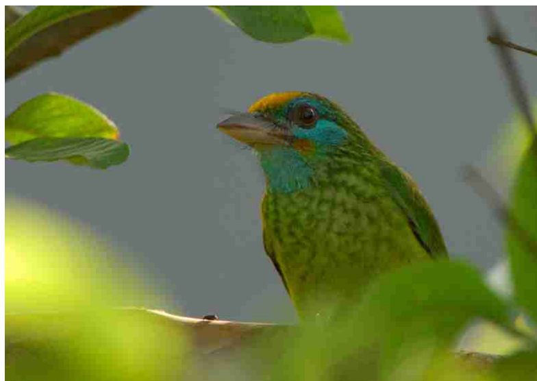
Fuglefauna i Sinharaja. Foto: Peter Price (2006)