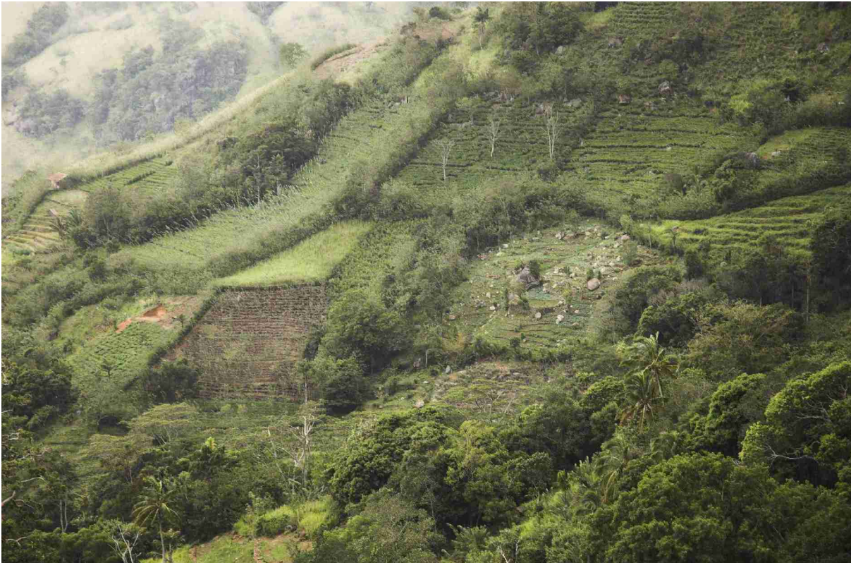
På vei over fjellet, fra Rakwana ned til Deniyaya: "Et majestetisk landskap".