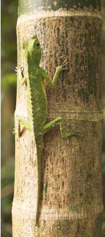
En gecko i Sinharaja, en av 20 arter