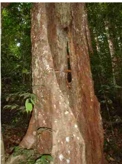
Dipterocarpus?