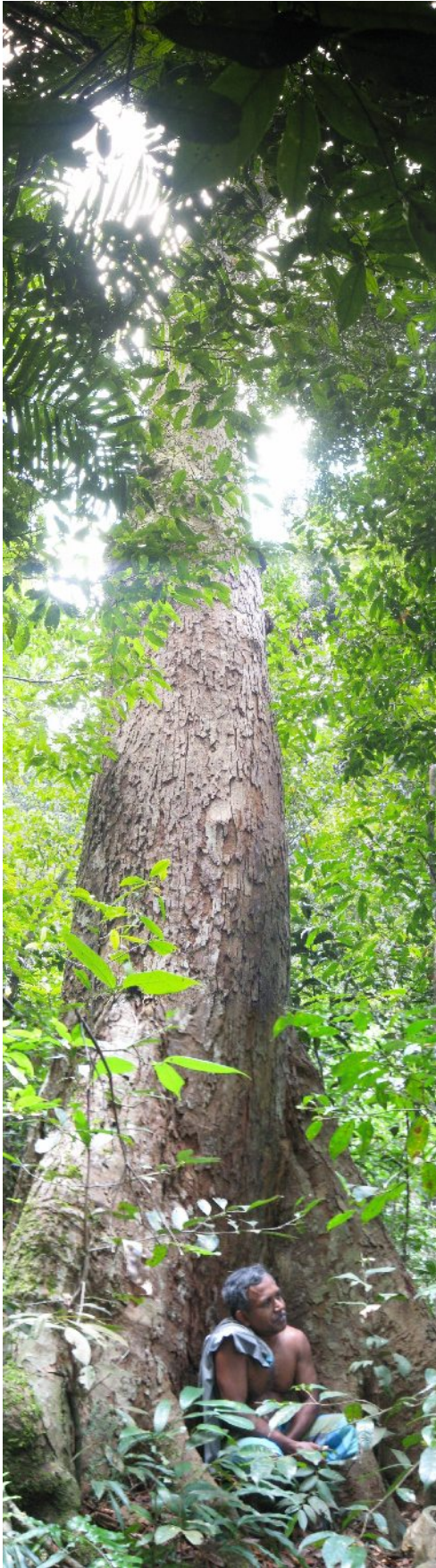
Siripala under et dipterocarp-tre (Hora) i Diyadawa-reservatet