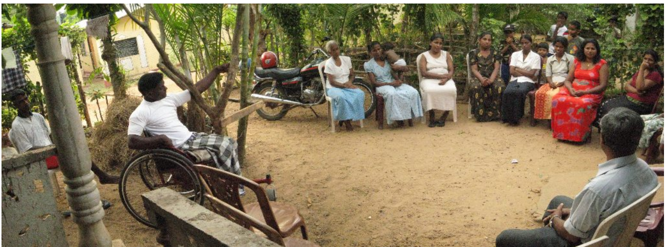
Foreldremøte i Millaniya, landsbyen med krigsinvalid og tsunami-fordrevne.