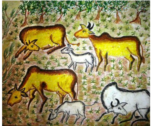
”Beitedyr i Dolahena”.

Men om vi skal ha noen glede av dette fundamentet, så bør vi ha tilknytning til en folkehøgskole, -lokallag eller -gruppe. Vi har nevnt det før, og må igjen beklage at dette fortsatt henger i en tynn tråd. Og hva gjør man med en tynn tråd – når en først er ute og ror? Da monterer man pilk på tråden og henger den etter båten; kanskje en eller annen biter på? Fosen folkehøgskole har blitt utfordret; kanskje de en dag ser sitt historiske ansvar? Seniorlaget i norsk folkehøgskole har drøftet saken, og vil ta det opp på sin neste samling til sommeren. Vonheims Venner har lovt å drøfte saken på førstkommende styremøte (uke 3).