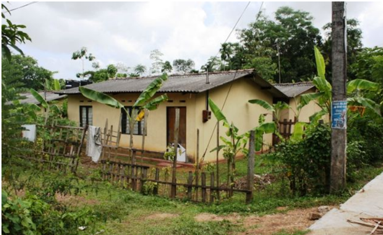
Kjøkkenhager i Millaniya

HELP søker å beskytte både det menneskelige fellesskapet og miljøet. Naturvernet skal prioriteres på samme nivå som mennesket. Dersom miljøet beskyttes, vil miljøet også gi bolig til menneskene i et land som Sri Lanka. Å beskytte regnskogen, hvordan hindre jordskred og hvordan drive egen kjøkkenhage er noen av favoritttemaene. Folk i Sri Lanka er vokst opp med å plante og høste til eget kjøkken, samt selge for å tjene penger. HELP forsøker å sette dem i stand til å drive kjøkkenhagen mer systematisk.