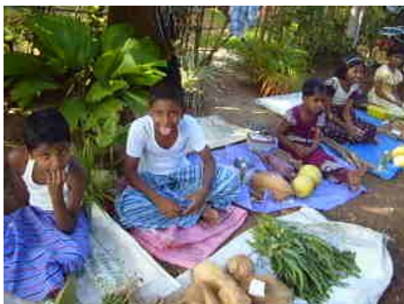
Fra Children's Fair i Millaniya