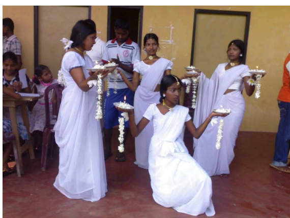
Kulturskolen underholder i forbindelse med nyttårsfeiringen og cricket-turneringen.