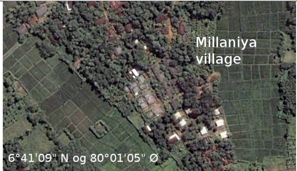
Landsbyen Millaniya, 7 km sørvest for Horana. Her har myndighetene plassert tsunami-flyktninger og familier av krigsinvalid, i rekkehusene midt i google earth-bildet.

Det er ikke bare barna som får ekstra-undervisning; også foreldrene og de voksne i distriktet får en viss opplæring av HELP i for eksempel økonomi og sparing. Folk som ikke er vant til å utnytte de nærmeste ressursene (kjøkkenhagen) til et enkelt og rimelig liv, blir undervist av HELP-folk: Hvordan skal jeg hjemme-kompostere, eller hvordan skal vi beskytte oss mot dengue- og malariamyggen?