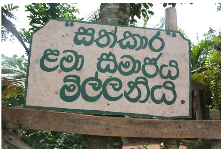
Oversatt: Sathkara children's society, Millaniya

Da jeg besøkte dem, lot elevene til å være svært glade for undervisningen de fikk. Ikke bare barna, mens også de foresatte. Foreldrene blir lykkelige når de ser at barna får en utdanning de ellers ikke hadde hatt råd til å betale. Tradisjonelt har barna fulgt i foreldrenes fotspor og droppet ut av skolen for å få seg arbeid når livet ble for tøft.