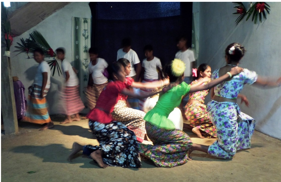
Sathkara-skolen legger stor vekt på dramatisering av tradisjonelle sanger og fortellinger. Her fra årets avslutning av kulturskolen i desember 2015.