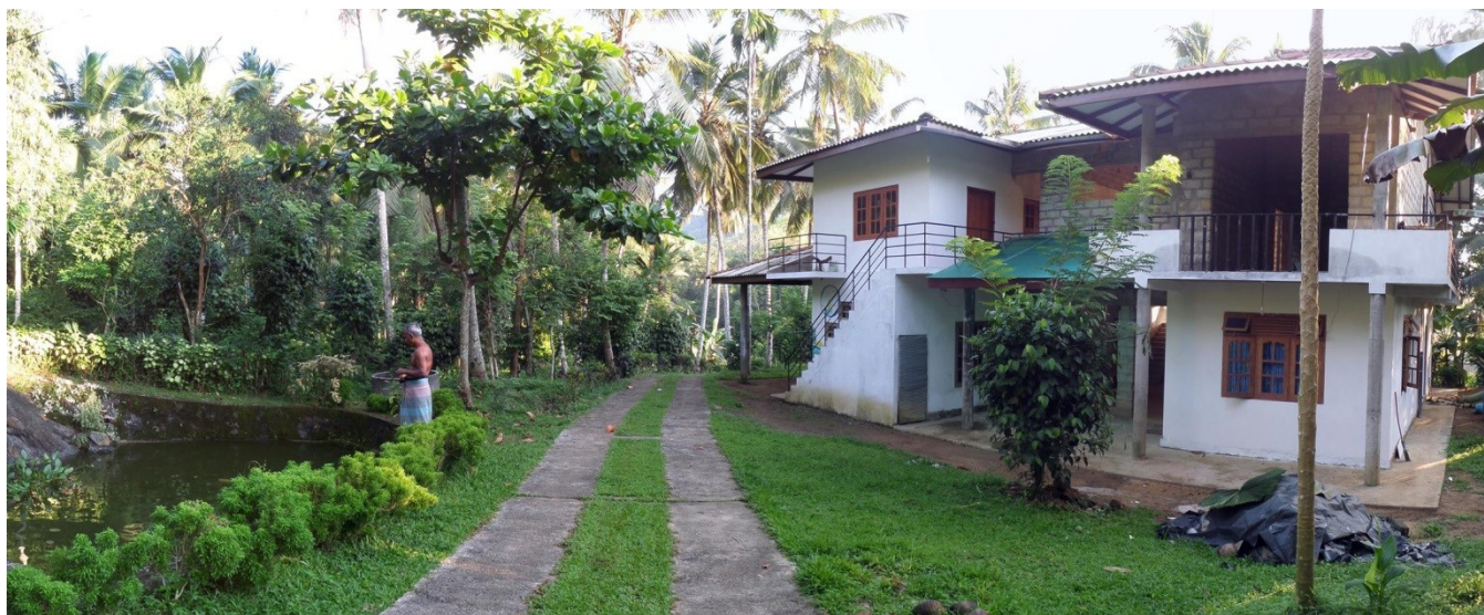
Nybygget utgjør høyre del av bygningen på bildet. Det gamle skolebygget utgjør venstre halvdel.

Sathkara-skolen er i gang igjen etter Vesak-feiringen i slutten av mai. Om lag 25 barn driver ulike kultur- og miljøvernaktiviteter, i tillegg til at de får engelsk-undervisning og praksis på data-maskiner.