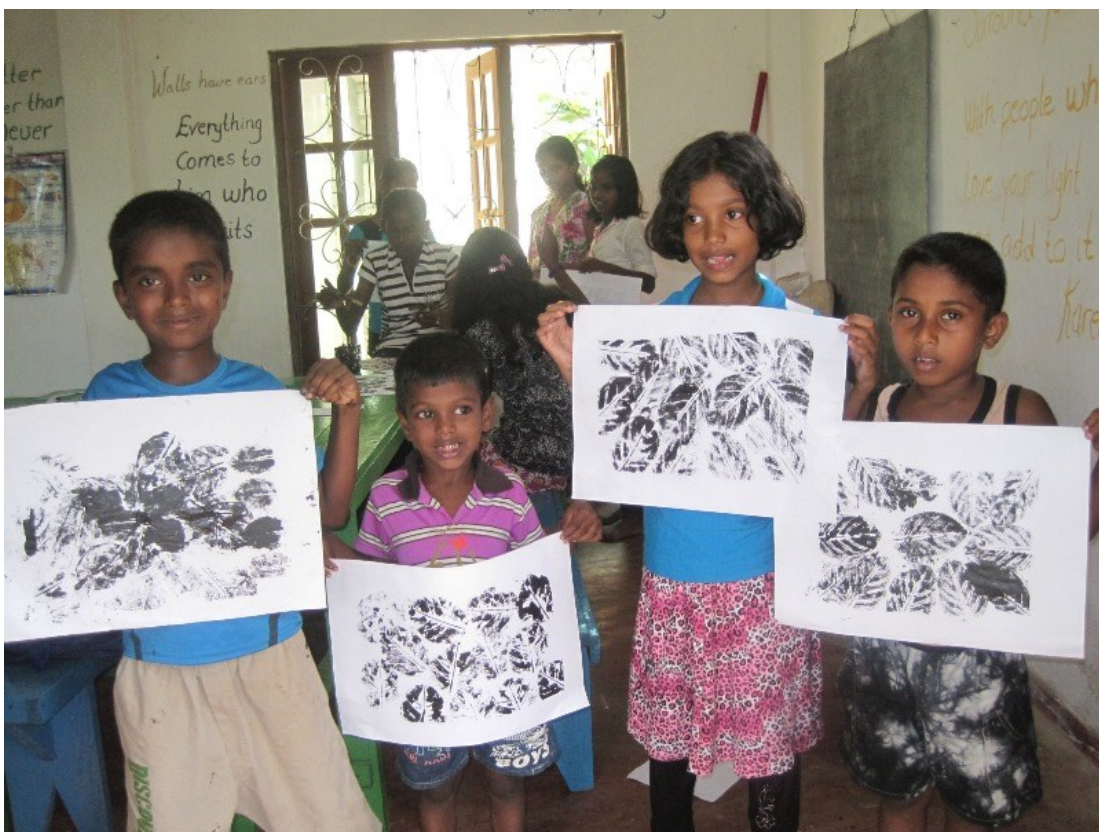
Unge talenter ved Sathkara-skolen, med kunsttrykk på papir.